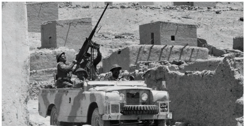
Palestina, 1970, Septiembre Negro.

¿Actualmente este nuevo hombre puede construirse? Entendemos que el trabajo voluntario no es para las transnacionales, ni tiene que ver con aquel discurso de “ponerse la camiseta” por la empresa. El trabajo voluntario es trabajar organizativamente para iniciar nuevos caminos hacia el socialismo. Como compañeros y compañeras de la OLEP, nuestro compromiso es voluntario, hacemos el trabajo de crear un periódico de acuerdo a las necesidades del pueblo, salimos a brigadas informativas porque tenemos la convicción de que quienes nos escuchan son capaces de entender lo que decimos, porque nadie más que ellos viven día a día la desigualdad e injusticia en el país. Nuestro trabajo desde escribir un artículo, de salir a las calles, de asistir a un mitin, es una muestra de las convicciones por una vida mejor. Así, al retomar las palabras del Che Guevara, reflexionamos sobre nuestra actitud, sobre nuestra labor que sin duda cualquiera pueda realizar. Anhelamos contagiar, convencer, impulsar la construcción del ser humanos socialista, porque somos de la misma clase social de quienes nos leen, y por lo tanto, aquello que nace del individuo, nacerá en la futura colectividad. ■