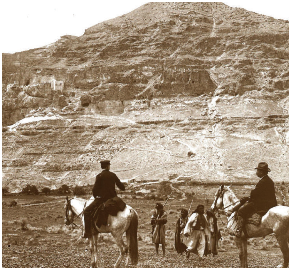
Monte de la Tentación. Palestina, 1910.

Y eso no ha cambiado en lo absoluto, tanto Slim como sus “amigos” los funcionarios