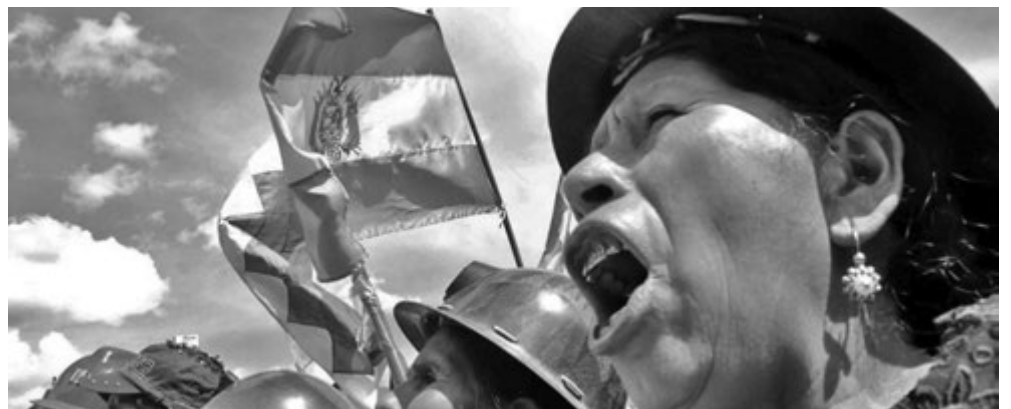
El pueblo de Bolivia conmemorando el Día de la Descolonización.

Los invito a luchar con nosotros, codo a codo, como hermanos de clase proletaria, pues sé que has sentido en algún momento lo mismo que yo, pero quizás no sepas qué hacer. Para eso estamos aquí, para luchar junto a ti como pueblo organizado, por el pueblo. ■