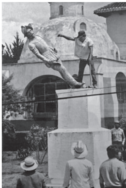
Derrumbe de la estatua de Diego de Mazariegos, Chiapas, 1992.