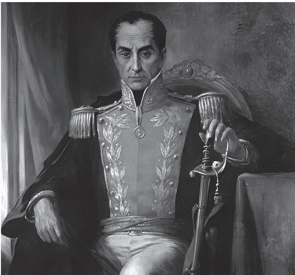
Pintura del revolucionario Simón Bolívar.

Para la Organización de Lucha por la Emancipación Popular es un honor y gloria escribir estas historias latinoamericanas de resistencia sobre personajes internacionalistas, patriotas, que ofrecieron lo mejor de ellos y divulgaron los sueños de independencia. "El suelo precioso que poseís, no debe ser el patrimonio del despotismo y la rapacidad". ■