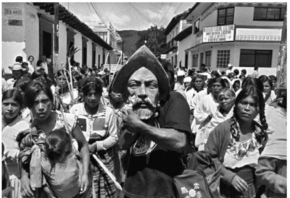
Derrumbe de la estatua de Diego de Mazariegos, Chiapas, 1992.