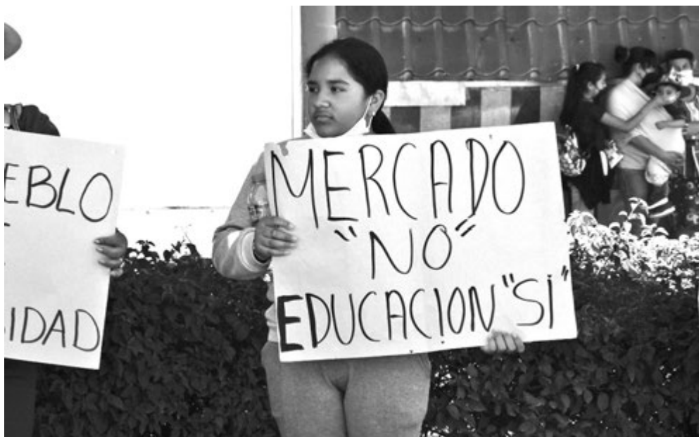
Manifestantes en contra del derrumbe de la escuela primaria de Tecamachalco.

El “gran proyecto” de construcción de la refinería Dos Bocas en Tabasco que se supone impulsaría el desarrollo económico y social del sureste mexicano es, en realidad, una de las tantas sedes de explotación y represión laboral. El pasado 13 de octubre, tras el segundo día de demandas por mejores condiciones laborales, los trabajadores de la empresa Ingenieros Civiles Asociados (ICA), dirigida por Bernardo Quintana Issac, fueron reprimidos por policías estatales, quienes, con gas lacrimógeno, detuvieron a tres trabajadores y dejaron, por lo menos, a otros tres heridos. Ante esto la secretaria de Energía, Rocío Nahle, aseguró que tras la represión no hubo ningún herido y acusó a los manifestantes de haber atacado a los elementos de seguridad con piedras, mientras que el actual presidente de la república mexicana, Andrés Manuel López Obrador, se deslindó de lo sucedido con el pretexto de que el conflicto no era cuestión laboral sino una disputa entre sindicatos. De las demandas de los trabajadores, como equipos de protección, prestaciones y mayor seguridad, las denuncias de los bajos salarios o falta de pago de horas extras no mencionaron nada. Con ello sólo se evidencia una cosa: que el desarrollo económico que promete el proyecto de la Cuarta Transformación no vela en favor de los clase obrera, por el contrario, solapa y perpetúa la explotación y enriquecimiento que empresas como ICA generan a costillas del pueblo.