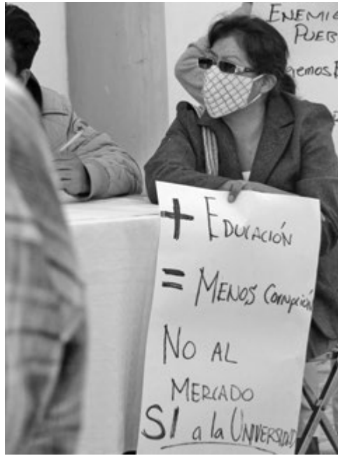
Manifestantes de Tecamachalco, Puebla, en contra de la construcción de un centro comercial.

Mientras tanto, el Partido Acción Nacional, ya acostumbrado a ir contra cualquier comentario que haga el presidente, sentenció a sus aliados del “Pacto por México”, es decir al PRI, que si ellos se proponen apoyar hasta en la más mínima coma a la iniciativa enviada se acaba el pacto y tan enemigos como siempre, o sea juntos, pero no revueltos.