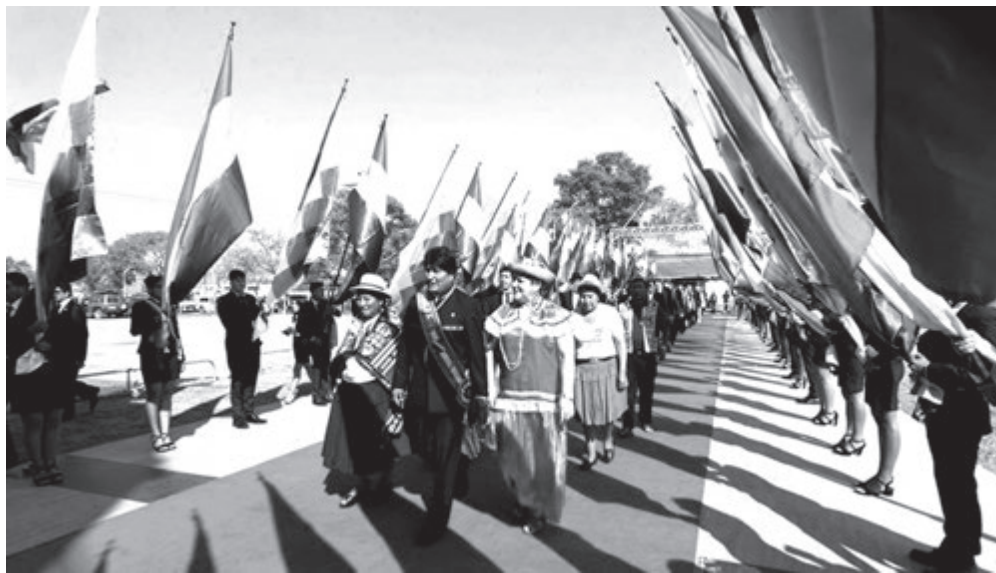
Celebración del Día de la Independencia en Bolivia.

Ya no hay tiempo para la lectura, para la formación política, para la movilización. La solidaridad que en algún momento se prestó para obtener esos proyectos ya no se demuestra hacia otros procesos ni mucho menos se ata con la lucha por la democracia popular y el Socialismo.