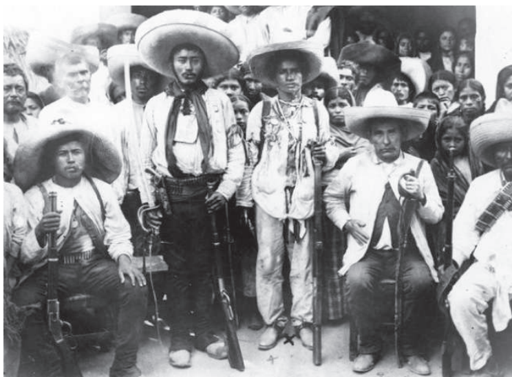
Amelio Robles con revolucionarios zapatistas.

Al analizar estos datos vemos que en el socialismo —incluso en las condiciones más adversas para su desarrollo como sociedad— los niños, su salud y su educación son prioridades. Como hemos dicho, a pesar del bloqueo económico a la isla del Caribe, la infancia allí goza de una mejor calidad de vida. Para reafirmar estas conclusiones, otras cifras nos indican que, al menos para 2010, año en que pudimos encontrar cifras comparativas, Cuba gastó 550 euros per cápita (por persona) en educación, mientras México destinó 439. Asimismo, en gasto público en salud per cápita , con cifras de 2014, Cuba destinó 561 euros; México, sólo 232 =