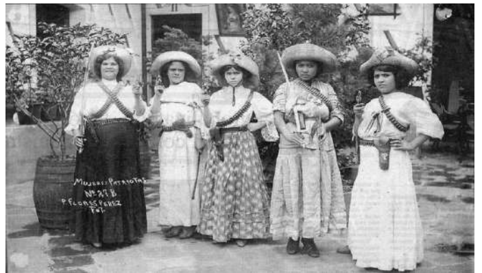
Mujeres en la Revolución mexicana.

¡Únicamente a través del socialismo encontraremos el camino de justicia para todos los pueblos!