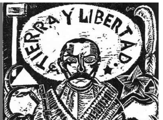
Zapatismo y socialismo.

táticas e incluso consignas del pasado siguen resonando y siendo oportunas al día de hoy.