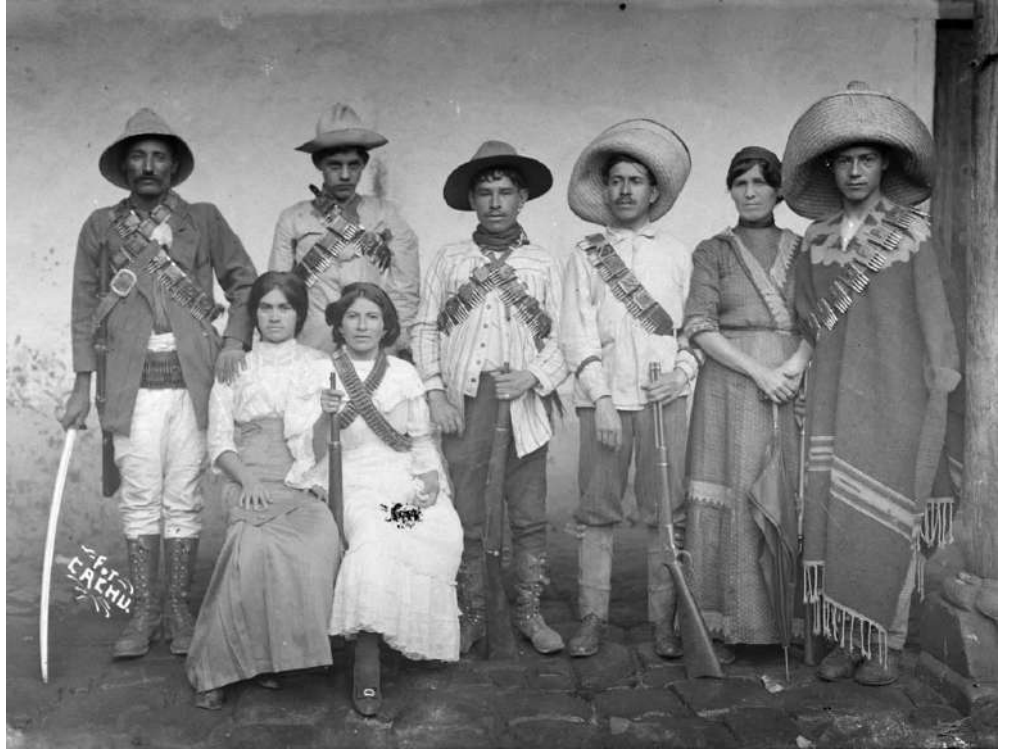
Mujeres en la revolución.

“Artículo 182: Se impondrán una multa de 4 a 30 Unidades de Medida y Actualización (UMA), conmutable por un arresto de 3 a 20 horas a quien: