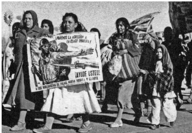
Mujeres participando en la “Marcha de la Dignidad” de 1951 en Coahuila.

Empresas como Foxconn, Aptiv, Johnson Controls, Anbec, Bombardier, Caterpillar, Cargill, Daimler, Honeywell, Nucor, Raytheon, Bosch, Procter and Gamble, 3M, ArcelorMittal, Hisense, Collins Aerospace, Newell Brands, Sharpie, Paper Mate, Foxconn, Emerson, Toro, Tecma, Keytronic, Siemens, Arneses Automotrices, Sistemas Integrados, Werner Company, Regal y Lear Corporation, son algunas empresas con capital gringo, que aprovecharon las oportunidades que brinda nuestro país, como los salarios bajos, falta de seguridad social y laboral, largas jornadas de trabajo, etc., para reducir los costos de producción y elevar sus ganancias; además de esto los estados fronterizos quedan muy cerca de nuestro vecino, cuentan con excelentes vías de comunicación y como cereza del pastel pueden exportar sin pagar im-