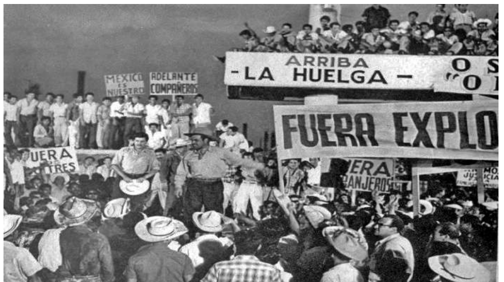
Mitin por la huelga petrolera en mayo de 1937, movimiento que logró la expropiación petrolera.

Por ese compromiso se dirigió a Santiago de Cuba para enterarse de quién era Fidel Castro, ese hombre del que había oído hablar, pues ya estaba preso por el intento del asalto al cuartel Moncada, y que conocerlo comparte con él un mismo sueño.