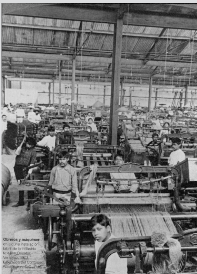
Obreros y máquinas en alguna instalación fabril de la industria textil en Orizaba, Veracruz, 1903. Biblioteca del Congreso Washington, D.C.

¡Proletarios de todos los países, uníos!