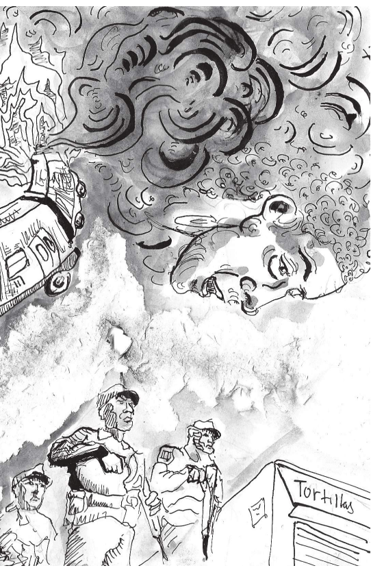
itares, obreros e inflación.

Sólo cuando se den estas condiciones, se lograrán las condiciones reales de una verdadera democracia y de vivir en una sociedad socialista donde los empresarios no decidan quién come y quién no. ■