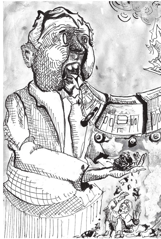
Colapso de la Línea 12, mil

tomando ritmo”; es decir, que no tiene para cuándo. Esta “reapertura” soluciona un poco el flujo, pero sin duda quienes se han visto afectados durante estos largos meses siguen sin resolver mucho, ya que el tráfico de Av. Tláhuac, en la parte del tramo elevado de la L12, sigue igual de pesado. Enton-