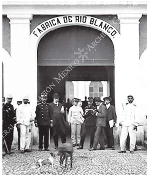
Fábrica de Río Blanco, Veracruz.

Anuradha Ghandy creció en medio de importantes acontecimientos históricos nacionales e internacionales, los cuales fueron determinantes para decidir ser parte del movimiento revolucionario de su país. La lucha histórica del pueblo de Vietnam por su emancipación y la instauración de un gobierno socialista y la Gran Revolución Cultural Proletaria bajo el liderazgo de Mao Tse-Tung en la República Popular de China causaron una profunda impresión en todas partes y fueron fuente de inspiración para los jóvenes de esa época, incluida Anuradha.