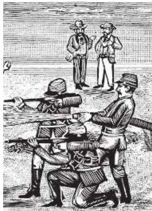
Represión del ejército mexicano.

Empresas como Nestlé, Coca-Cola, PepsiCo, Unilever, Mondelez, ADM, Bayer, General Mills, Sysco Corporation y Danone son las empresas de bebidas y alimentos, en granos y procesados más grandes a nivel mundial y que más ganaron.