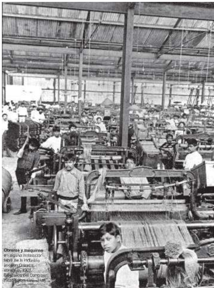
Fábrica obrera textil.

Sabemos que para poder llevar a la práctica esta propuesta, la única manera es mediante la organización independiente del pueblo, pero esta lucha también debe ir acompañada de una lucha más amplia no sólo por un mayor pago de impuestos de los grandes empresarios, sino también por mejorar las condiciones de vida del pueblo, por la democracia popular y el socialismo. ■