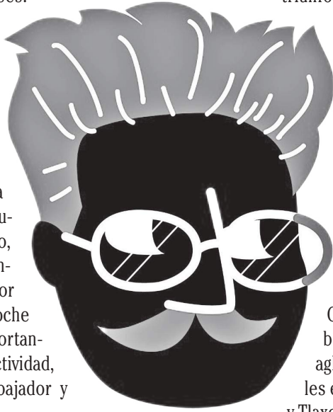
Ricardo Flores Magón

El 3 de enero de 1907, Díaz emitió un laudo que, por un lado, daba ciertas concesiones: nivelaba salarios, establecía un sistema de primas por producción, se eliminaban descuentos para fiestas, se eliminaban descuentos por uso normal de instrumentos, pero, al mismo tiempo, desconocía la bilateralidad y la representación colectiva, estableciendo que las peticiones laborales debían realizarse a título personal. El laudo desmovilizó a la mayoría de los obreros textiles, los cuales levantaron la huelga. Incluso los obreros de Río Blanco aceptaron en su mayoría el laudo, pero hubo muchos que protestaron contra él, incluso los dirigentes obreros de Río Blanco se dividieron. Parecía claro que al día siguiente, el 7 de enero, habría labores normales, con todo y los inconformes. Sin embargo, la situación explotó. Evidentemente no sólo se trataba de