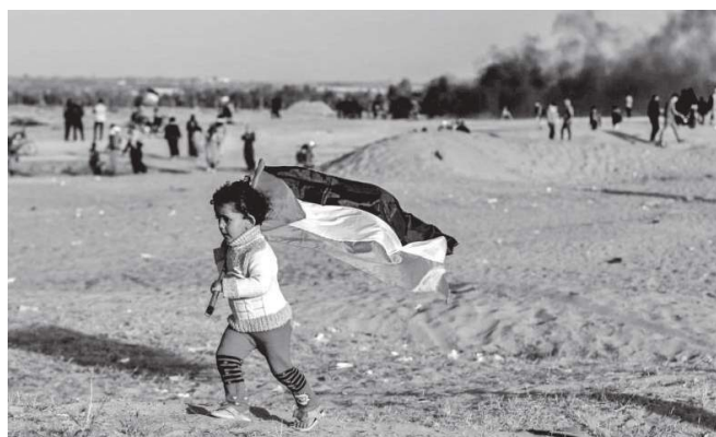
Hasta el día sábado 14 de octubre, el Estado de Israel ha asesinado 724 niños palestinos en ataques a civiles.

¡Contra el despojo; la represión y la explotación; resistencia, organización y lucha por el socialismo!