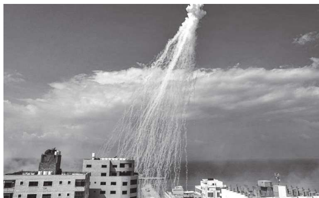
Fósforo blanco, arma química incendiaria prohibida en la Convención de Ginebra utilizada por Israel contra el pueblo palestino.