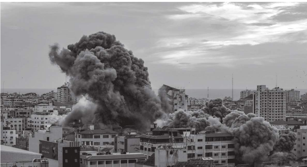
Bombardeos de Israel en Gaza, a edificios con población civil.

El ejemplo más claro del discurso enajenador de quienes se presumen estudiantes fue lo sucedido durante el despojo de nuestro espacio. En ese momento vimos que ha permeado el discurso elitista, clasista e individualista, pues hicieron un llamamiento al morbo y la violencia, justificándose con mentiras y difamación. Esuchamos el reproche “¿y qué han hecho por mí?”, en oposición a la explicación de que se lucha por el pueblo. Escuchamos las críticas más viscerales que pudieran decir con base en la calumnia y mentira. Esas fueron algunas de las justificaciones para tomar nuestro espacio. Desde el momento en que publicó la “Colectiva Rabia Encapuchada” su conformación, explícitamente advirtieron que en su espacio no habrá “ideologías ni líderes”; pero como ellas se dicen estudiantes pregun-