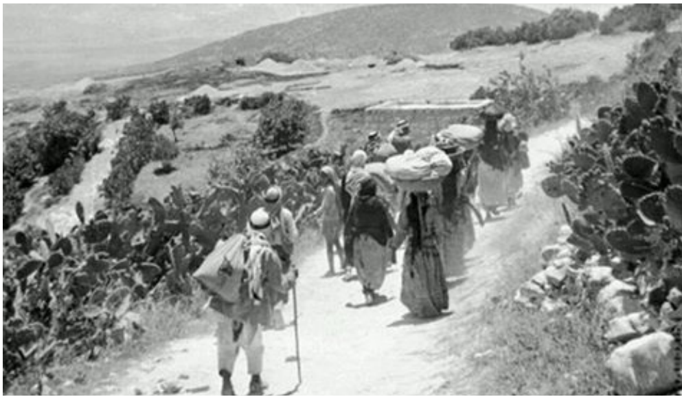
Éxodo Palestino 1948.

Actualmente el consejo directivo de la empresa se encuentra en manos de “Los Cuatro