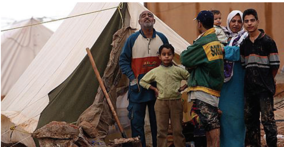
Refugiados palestinos en Irak durante la guerra.

El Colectivo por la Paz en Colombia desde México (Colpaz) es un espacio de personas refugiadas, migrantes y retornadas que desde el exterior emprenden acciones para denunciar la violencia histórica ejercida por el estado colombiano y exigen la implementación del acuerdo de paz firmado entre la guerrilla de las FARC-EP y el gobierno en el año 2016.