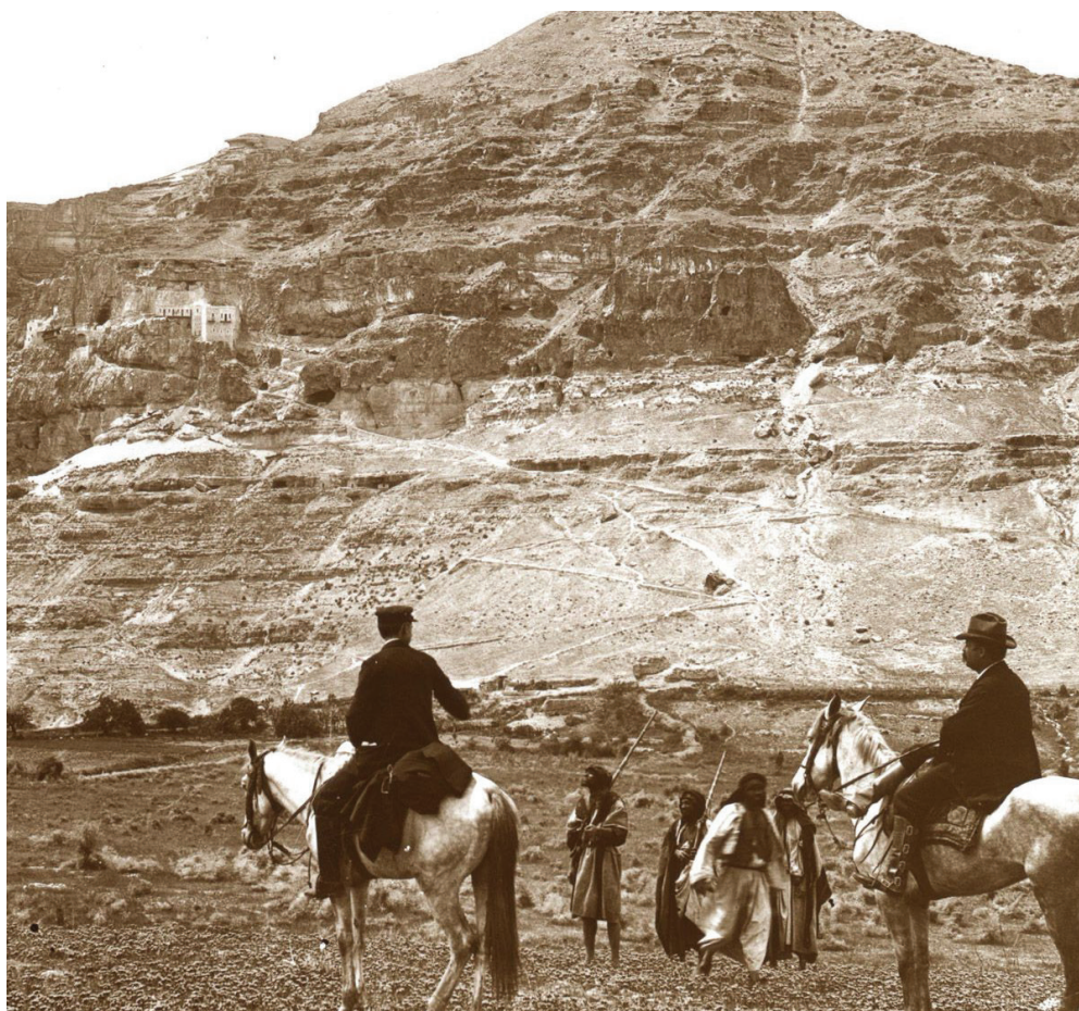
Monte de la Tentación. Palestina, 1910.

Y eso no ha cambiado en lo absoluto, tanto Slim como sus “amigos” los funcionarios