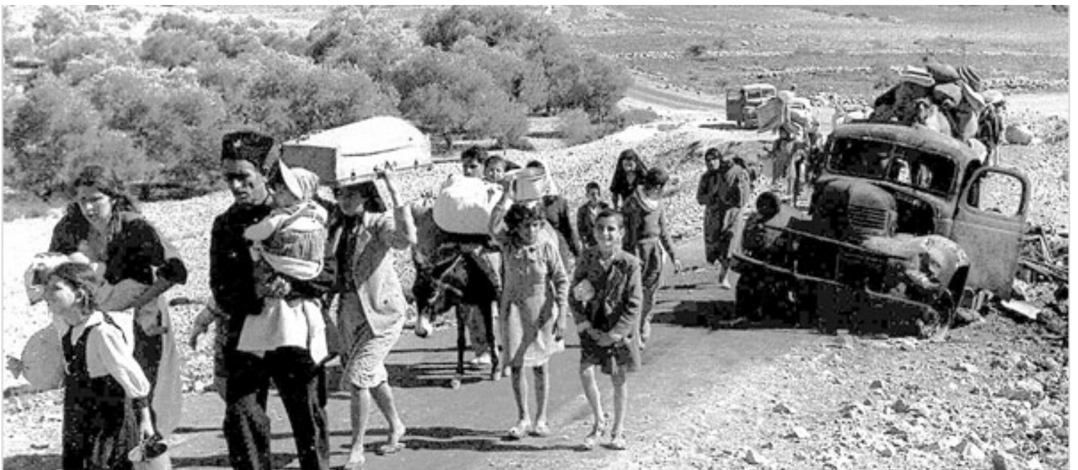
Refugiados palestinos en la carretera del Líbano tras haber huido o haber sido expulsados de sus hogares en la Galilea (noviembre de 1948).

Por eso como Organización de Lucha por la Emancipación Popular (OLEP) estamos en contra de esta reforma. Si bien la 4T se ha diferenciado de los anteriores gobiernos como el Partido Revolucionario Institucional (PRI) y el Partido Acción Nacional (PAN), la represión de carácter político no ha desaparecido: las desapariciones, las detenciones arbitrarias, las reclusiones injustas, las ejecuciones extrajudiciales, así como también otras violaciones a los derechos humanos continúan. El haber perfeccionado dos de las herramientas más usadas de represión (lo militar con la GN y el espionaje con la PANAUT) y legalizarlas, crea un escenario complejo para todas las personas que se organizan, pues la experiencia durante los periodos más neoliberales fue de gran represión; debemos de luchar en contra de toda reforma que pueda afectar a la seguridad de las personas y exigir nuestros derechos humanos. ■