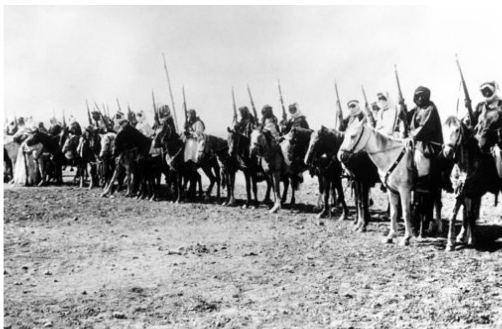
Jinetes árabes durante la Gran Revuelta cerca de Nablús, 1938.

¡Contra el despojo, la represión y la explotación; resistencia, organización y lucha por el socialismo!