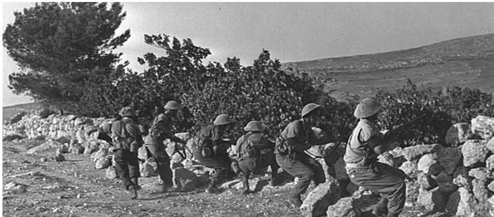
Guerra civil durante el mandato británico de Palestina 1947.

Las autoridades fueron progresistas al momento de crear el IEMS y la UACM (ambas en el periodo de Obrador como Jefe de Gobierno del entonces Distrito Federal) pero no fueron progresistas en las medidas laborales, pues