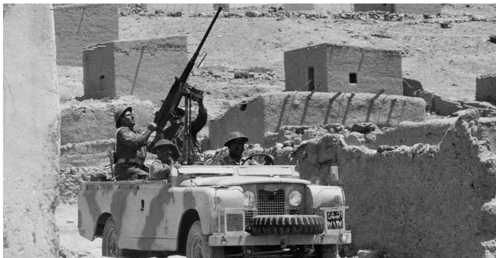
Palestina, 1970, Septiembre Negro.

¿Actualmente este nuevo hombre puede construirse? Entendemos que el trabajo voluntario no es para las transnacionales, ni tiene que ver con aquel discurso de “ponerse la camiseta” por la empresa. El trabajo voluntario es trabajar organizativamente para iniciar nuevos caminos hacia el socialismo. Como compañeros y compañeras de la OLEP, nuestro compromiso es voluntario, hacemos el trabajo de crear un periódico de acuerdo a las necesidades del pueblo, salimos a brigadas informativas porque tenemos la convicción de que quienes nos escuchan son capaces de entender lo que decimos, porque nadie más que ellos viven día a día la desigualdad e injusticia en el país. Nuestro trabajo desde escribir un artículo, de salir a las calles, de asistir a un mitin, es una muestra de las convicciones por una vida mejor. Así, al retomar las palabras del Che Guevara, reflexionamos sobre nuestra actitud, sobre nuestra labor que sin duda cualquiera pueda realizar. Anhelamos contagiar, convencer, impulsar la construcción del ser humanos socialista, porque somos de la misma clase social de quienes nos leen, y por lo tanto, aquello que nace del individuo, nacerá en la futura colectividad. ■