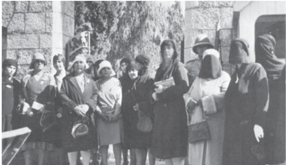
Integrantes del Congreso de Mujeres Árabes Palestinas, 1929.

También, se han denunciado cortes de luz y por ende de internet en ciudades capitales como Cali, Bogotá y Medellín, lo que ha tenido como consecuencia la imposibilidad de comunicar y denunciar el despliegue militar y policial ordenado por la presidencia. Militarización agravada por los civiles armados que disparan contra los manifestantes a plena luz del día y en comprobada connivencia con la policía, formas de represión instaladas desde la confor-