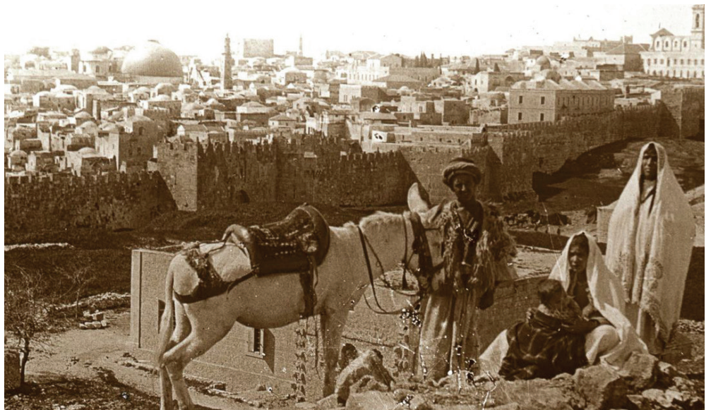
Jesuralén desde el monte Calvario.

Los hechos evidencian un claro abuso de autoridad y un grave desinterés para solucionar los problemas educativos que enfrentan las comunidades rurales. Esta es una razón más para luchar por los derechos humanos, la libre expresión y una justicia efectiva que verdaderamente esté a favor del pueblo.