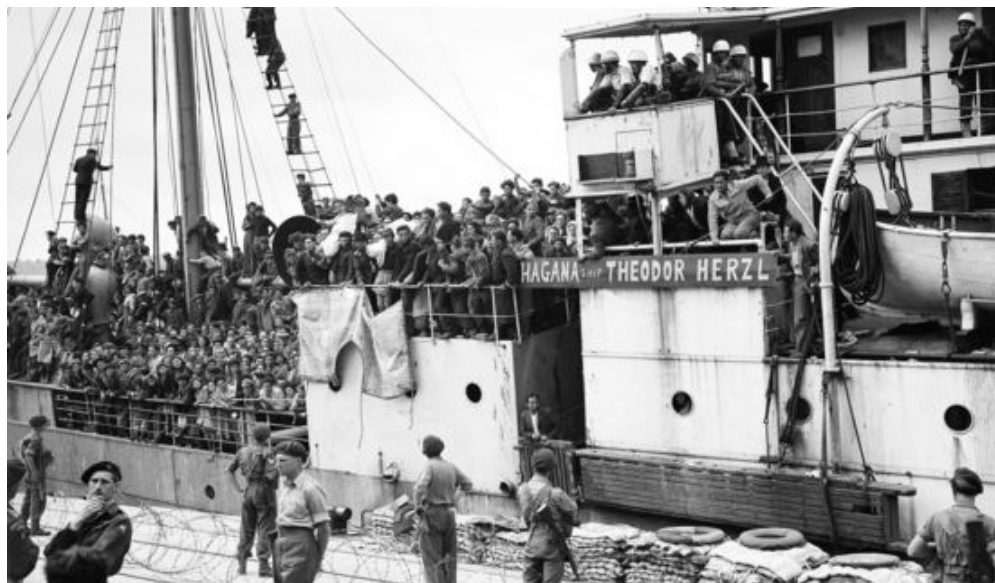
Immigrantes judíos a bordo del Theodor Herzl intentan desembarcar en Haifa, 1947.