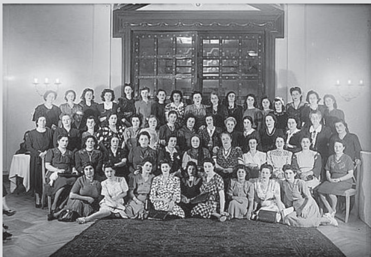
Asociación de mujeres árabes, 1929.

¡Contra el despojo, la represión y la explotación; resistencia, organización y lucha por el socialismo!