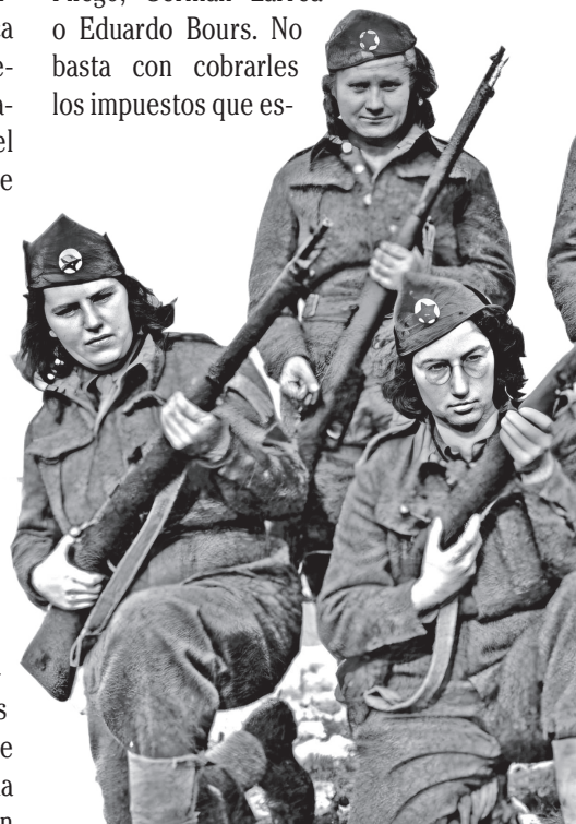
Mujeres en la resistencia partisana.

Por una sencilla razón, porque su política, es conciliar los intereses de la clase burguesa, dueña de los grandes medios de producción, y los intereses de la clase proletaria, dueña sólo de su fuerza de trabajo. Esto significa que sólo limita la rapacidad, pero los deja ser rapaces en muchos aspectos, véase como ejemplo a los acusados de beneficiarse del neoliberalismo por la venta de múltiples empresas estatales a precios bajísimos, hoy esos acusados son varios de los beneficiarios de las políticas económicas de este sexenio: Carlos Slim, Salinas Pliego, Germán Larrea o Eduardo Bours. No basta con cobrarles los impuestos que es-