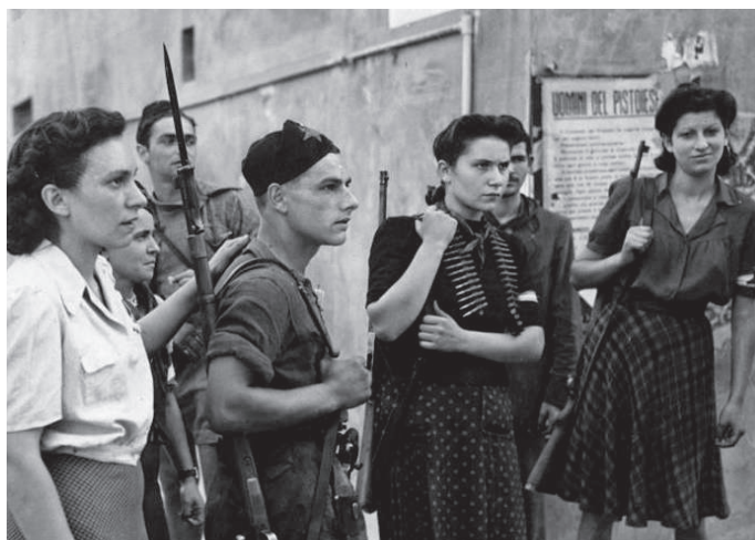
Mujeres en la resistencia partisana.

posición de la exvicepresidenta Dina Boluarte como nueva presidenta, el factor Pedro Castillo se desplazó por completo y se abrió nuevamente la confrontación más clara entre los grandes intereses del capital y su sistema político, y la reacción popular con demandas que van mucho más allá de pedir el regreso de Castillo a la presidencia, o del llamado a elecciones. Lo que siguió al golpe fueron fenómenos con diferentes grados de desarrollo, pero de un contenido de lucha claro, reacciones de comunidades originarias, campesinos, estudiantes y obreros en diferentes partes del país, que desplegaron una serie de formas de organización y movilización (marchas, planto-