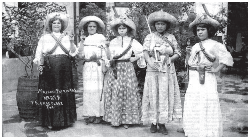
Mujeres en la Revolución mexicana.

Los estudiantes de aquel tiempo demostraron que sólo organizados podemos lograr grandes cambios en beneficio de la mayoría, pues durante los casi 30 años que duró la Reforma Universitaria, la UAP fue una universidad popular al no negarle el ingreso a cualquier aspirante que quisiera continuar sus estudios superiores, los planes de estudio cambiaron a fin de fortalecer una educación científica y crítica, por la cual se pagaban cuotas extremadamente bajas; además, aunque los gobiernos federales y estatales quisieron ahorcar financieramente a la UAP, no hubo pretexto para acelerar su expansión, ya que se fundaron nuevas facultades y preparatorias populares, incluso en 1969 se inauguró Ciudad Universitaria.