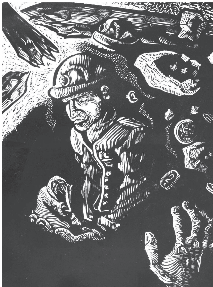
Por unos pesos. Hecho por @_juvenal_.

Este ejemplo nos deja claro al servicio de quien está el Estado, representado por las ins-