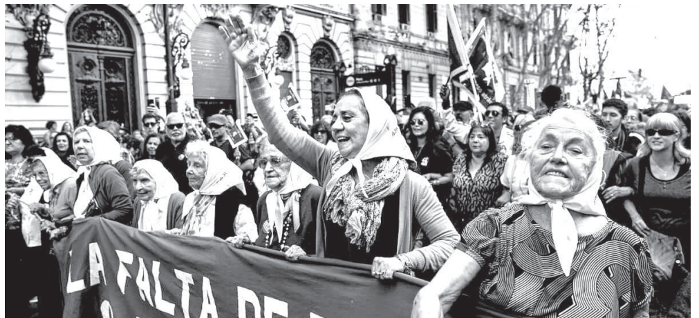
Movimiento de las Madres de la Plaza de Mayo, Argentina.