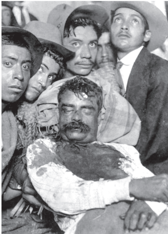
Este 10 de abril se conmemoran 105 años del asesinato de Emiliano Zapata.

Otra de las incoherentes declaraciones del señor más acaudalado del país es que Telmex ya no es negocio y que prácticamente está en quiebra, pues pagar pensiones a los trabajadores lo hace gastar mucho. Eso sí, a pesar de los pesares y aun pagando las pensiones, su fortuna asciende por arriba de los 103 mil millones de dólares y cada día aumenta.