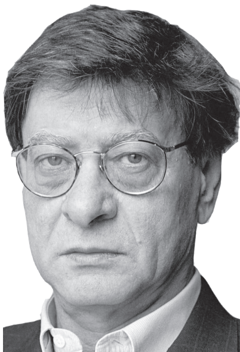
Mahmoud Darwish (1941-2008) es considerado el poeta nacional palestino, escritor de “Confesiones de un terrorista”.

1. “¿Cuáles son las consecuencias legales de la violación continua por parte de Israel del derecho del pueblo palestino a la autodeterminación, su ocupación, colonización y la anexión prolongada del territorio palestino ocupado desde 1967, incluidas las medidas para modificar la composición demográfica, el carácter y el estatus de la ciudad santa de Jerusalén, y la adopción por parte de Israel de leyes y medidas discriminatorias relacionadas?”.