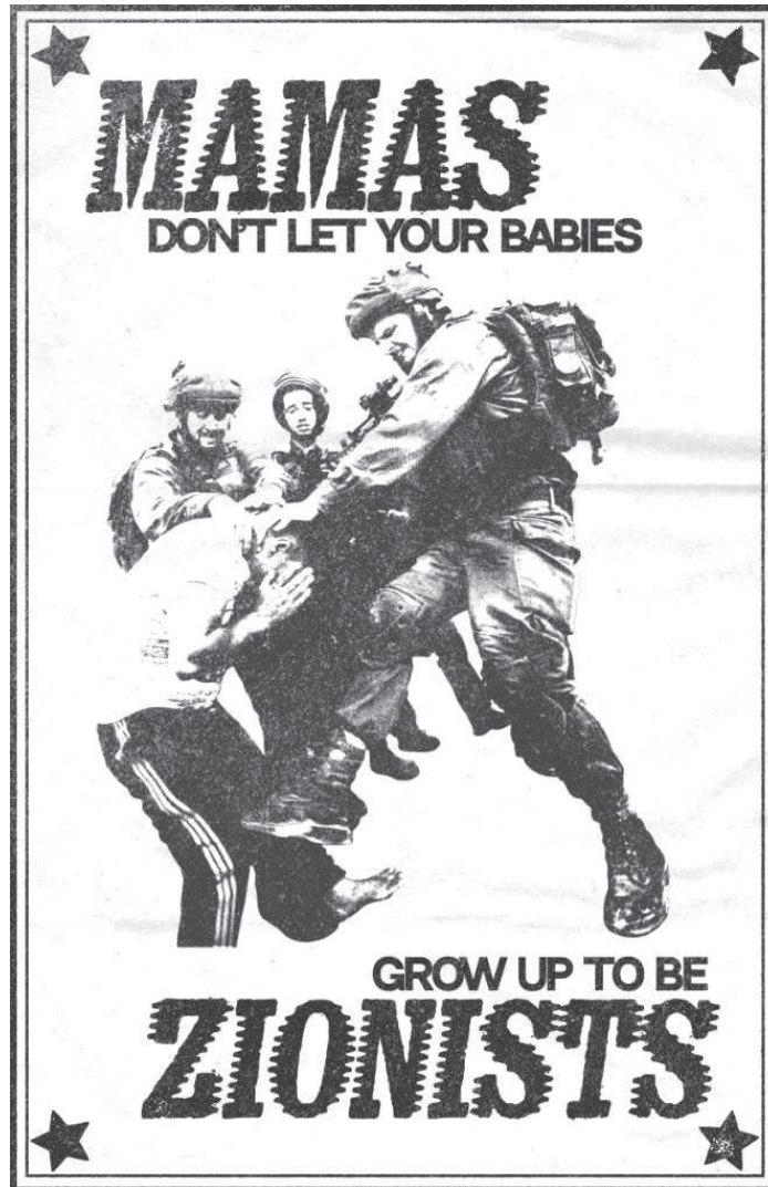
"Mamás, no dejen que sus bebés crezcan para ser sionistas".