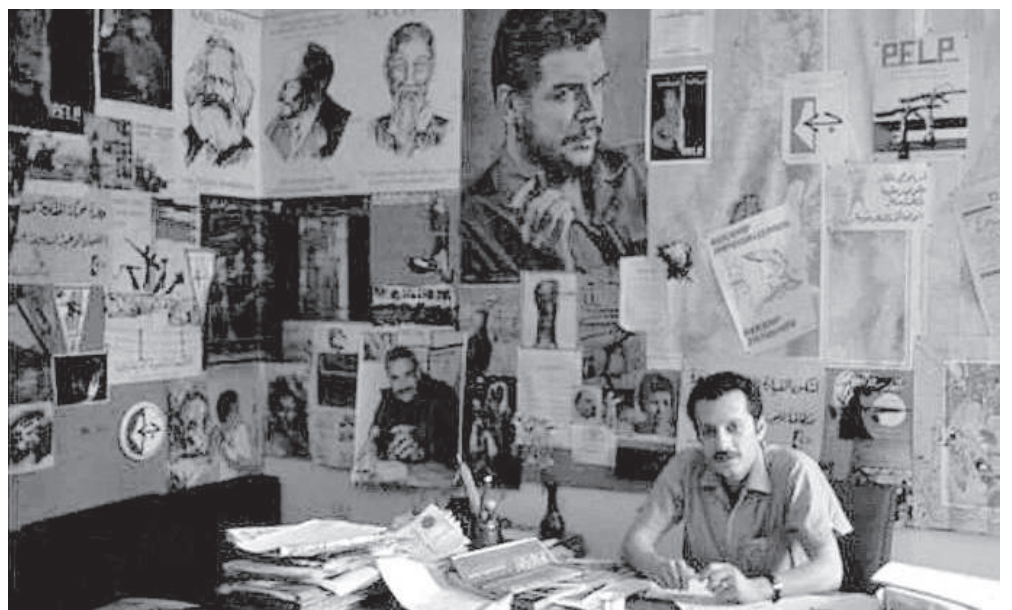
Ghassan Kanafani (1936-1972).